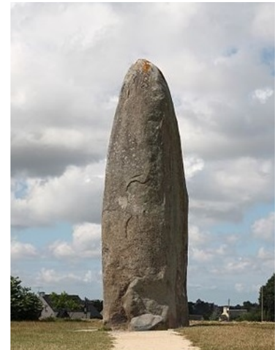
Menhir du Champ Dolent