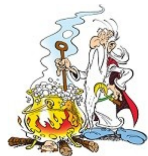
Getafix, The Druid from Asterix