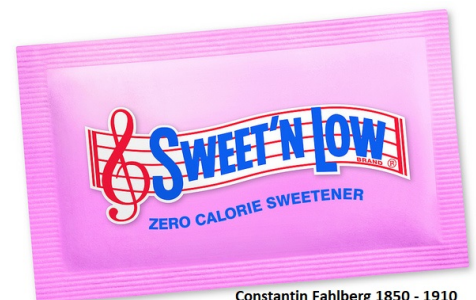
Constantin Fahlberg 1850 - 1910